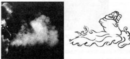
Ил. 5. Воздушная форма полугласного «w» (фото и прорисовка И. Цинке).

(как назвала их Цинке) были засняты на пленку высокоскоростной камерой. Тут можно было увидеть, как каждая форма в течение долей секунды возникает, достигает полного объема и