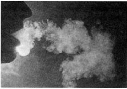
Ил. 6. Воздушная форма слога «ba».

вновь исчезает, причем каждый раз это происходит в другом темпе и другой манере. Тогда всякий звук речи предстает взору как текучее изваяние 142 .