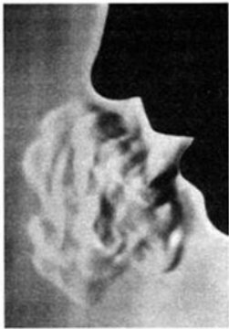
Ил. 3. Воздушная форма гласного звука «а».

Первым на эти незримые, порождаемые речью воздушные формы указал в 1924 г. Рудольф Штайнер 141 . Его замечание, что сделать их зримыми безусловно возможно, пользуясь соответствующими средствами, в 1962 г. было реализовано дрезденской учительницей Иоганной Цинке. Десятилетиями изучая эту тему, она смогла показать, что каждый звук речи и впрямь порождает перед ртом особенную, характерную только для него воздушную форму, причем явление это закономерно воспроизводится. Чтобы зримо отобразить отдельные формы и зафиксировать их с помощью фотоаппарата, Цинке поначалу использовала явление естественной конденсации пара при температурах ниже нуля. Но намного эффективнее оказался другой метод — перед произнесением какого-либо звука нужно было вдохнуть немного табачного дыма. Тогда возникающая воздушная форма оказывается насыщенной частицами дыма, и ее без труда можно видеть при комнатной температуре. Другим способом визуализации могут служить снимки, сделанные при помощи прибора Тёплера и интерферометра. (Снимок на ил. 3 сделан при помощи прибора Тёплера, остальные -обычные снимки выдыхаемого табачного дыма.